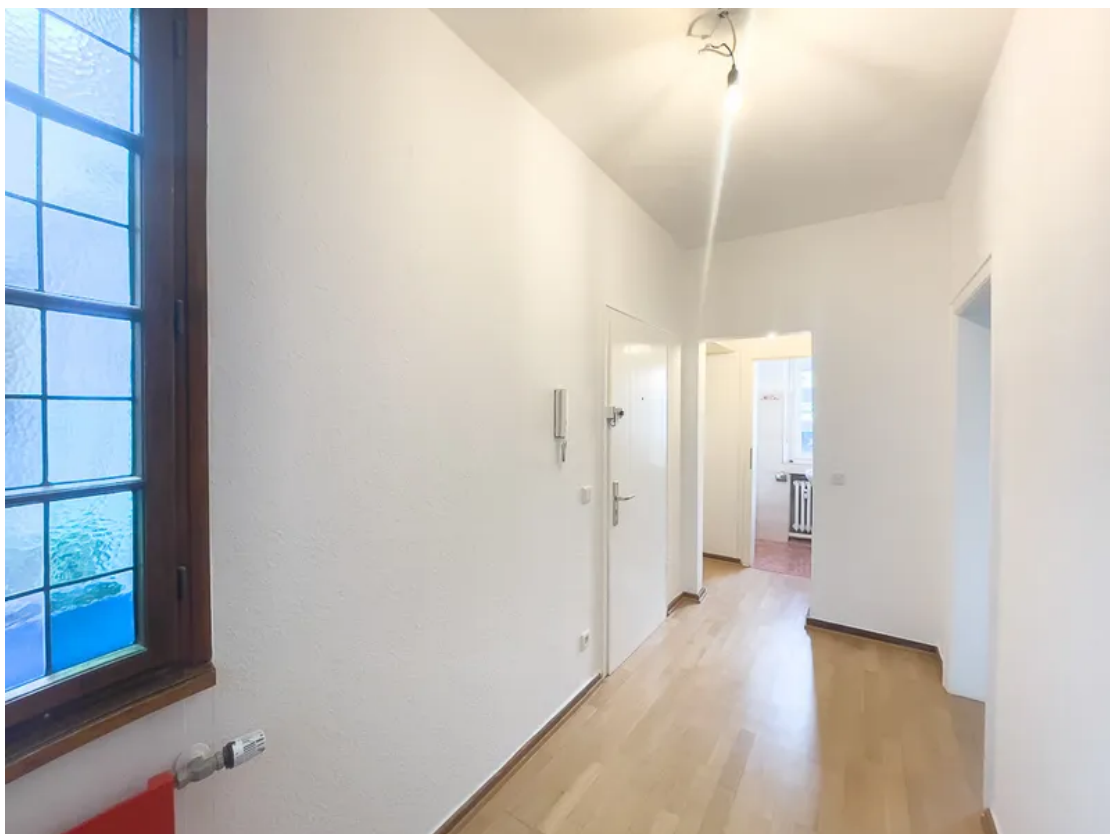
Diele mit Blick zum Gäste-WC