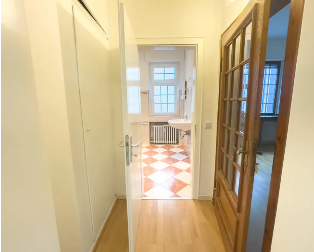
Flur mit Blick zum Badezimmer