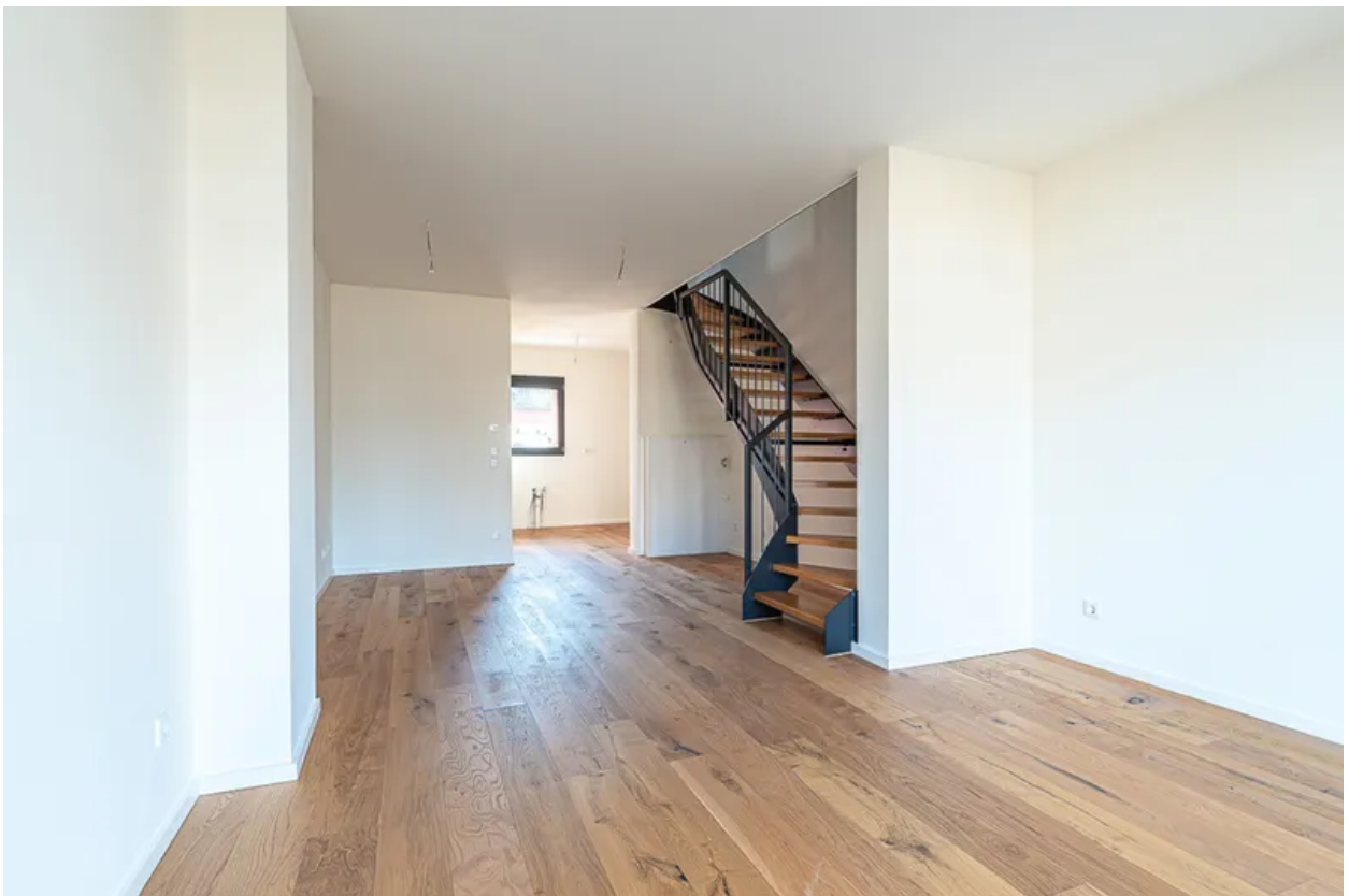
Blick zur Küche