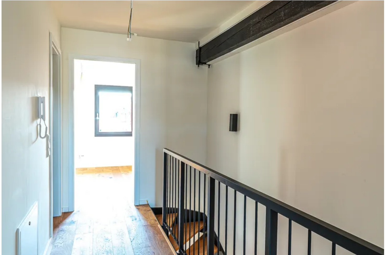
Flur in Düsseldorf - Vester Immobilien - Wohnung mieten in Elsdorf-3948