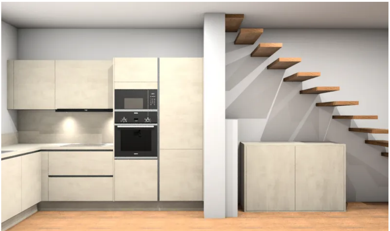
Küchenplanung Perspektive frontal