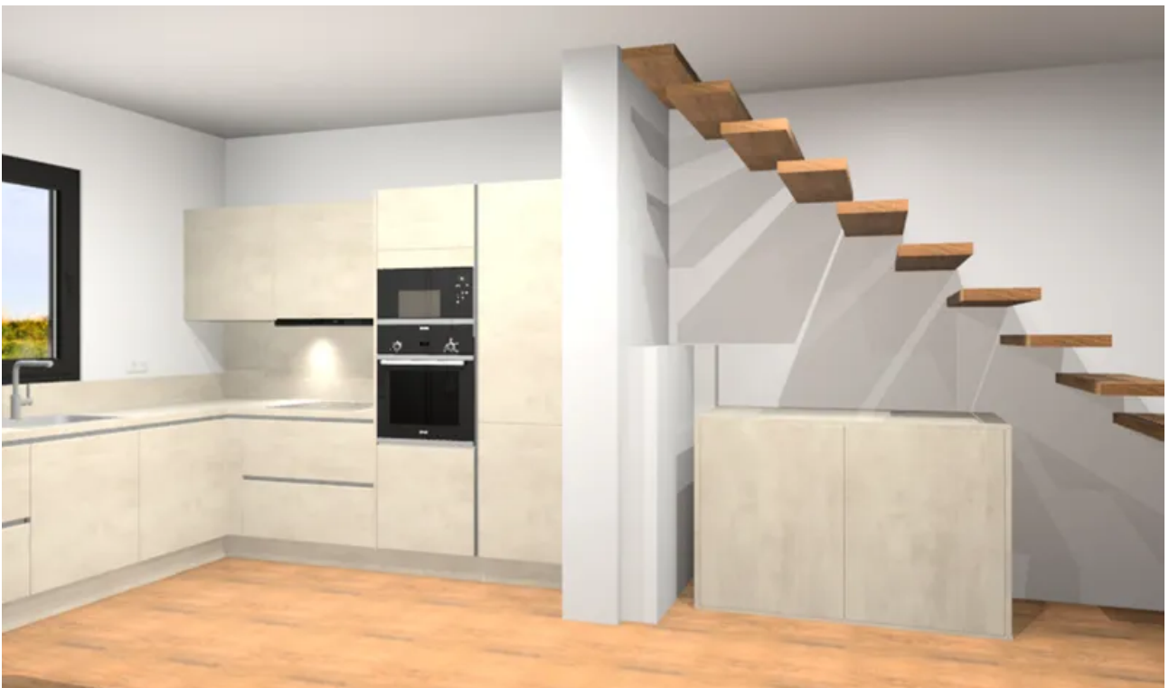
Küchenplanung Perspektive seitlich