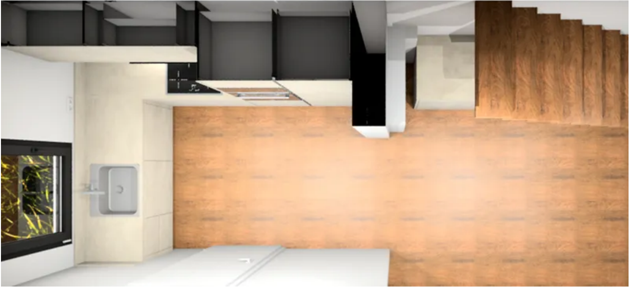
Küchenplanung Perspektive von oben