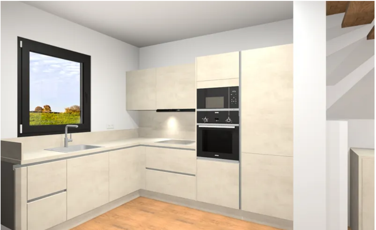
Küchenplanung Perspektive seitlich 1