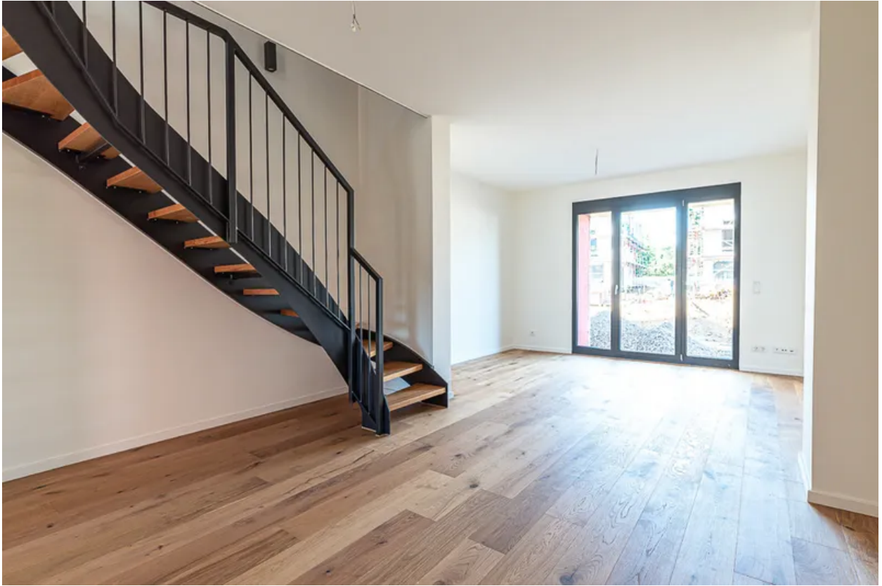
Blick zum Wohnzimmer