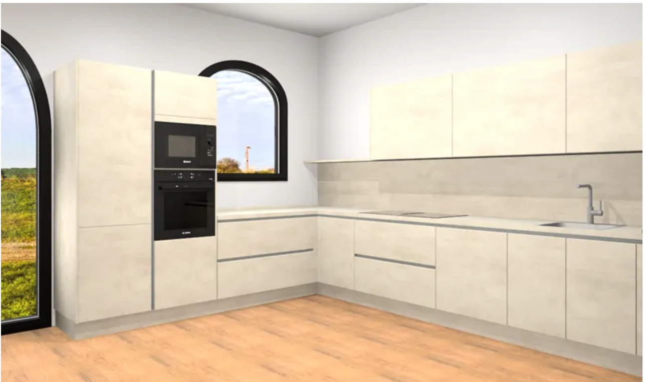
Küchenplanung WE 18 Perspektive frontal gesamt