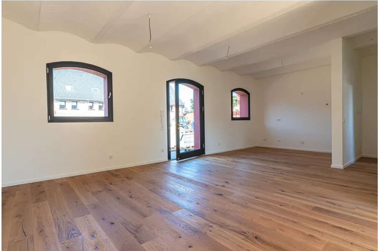
Blick zur Küche