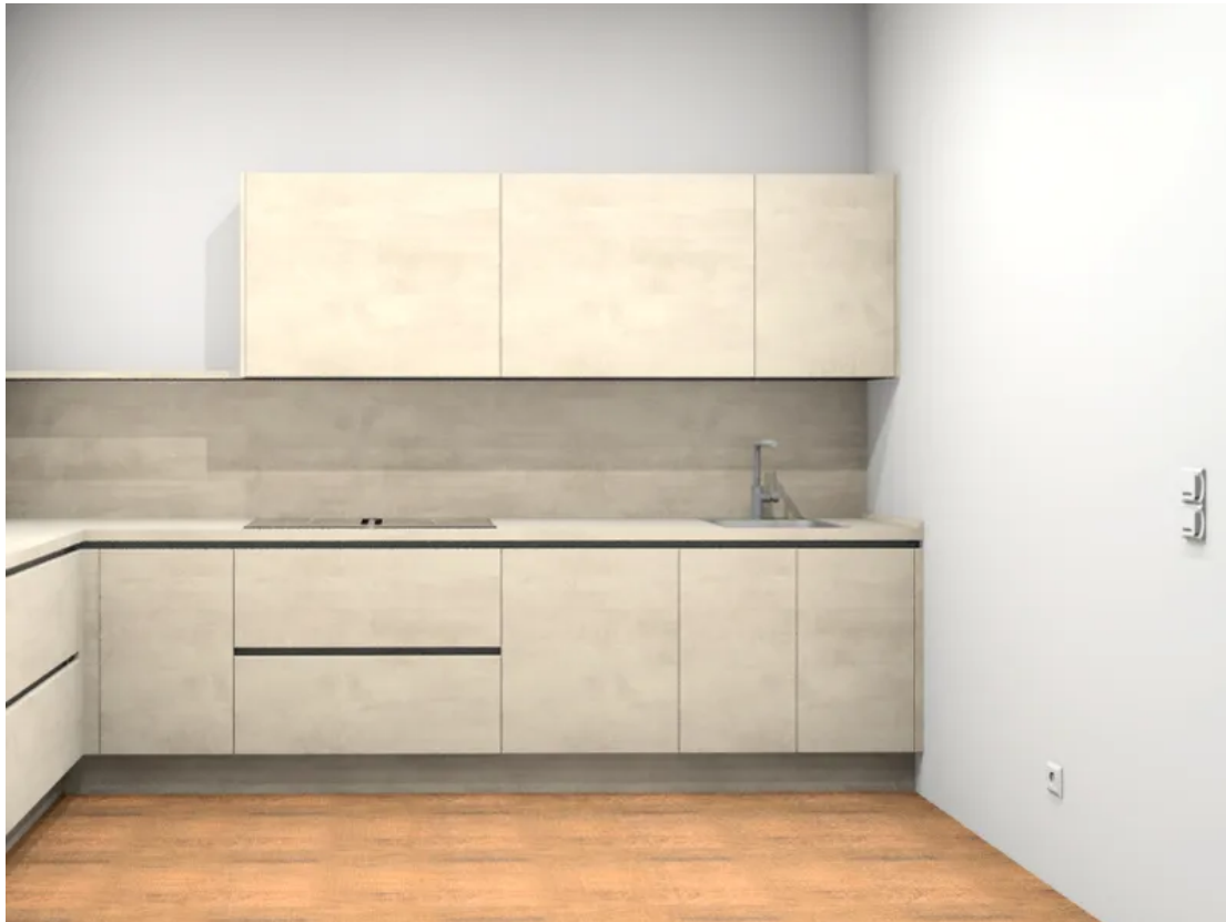
Küchenplanung WE 18 Perspektive frontal Spüle