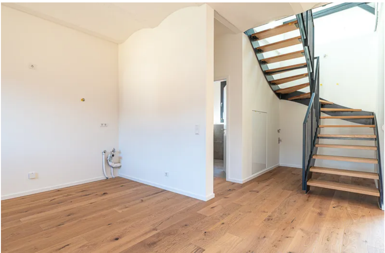
Blick zur Küche