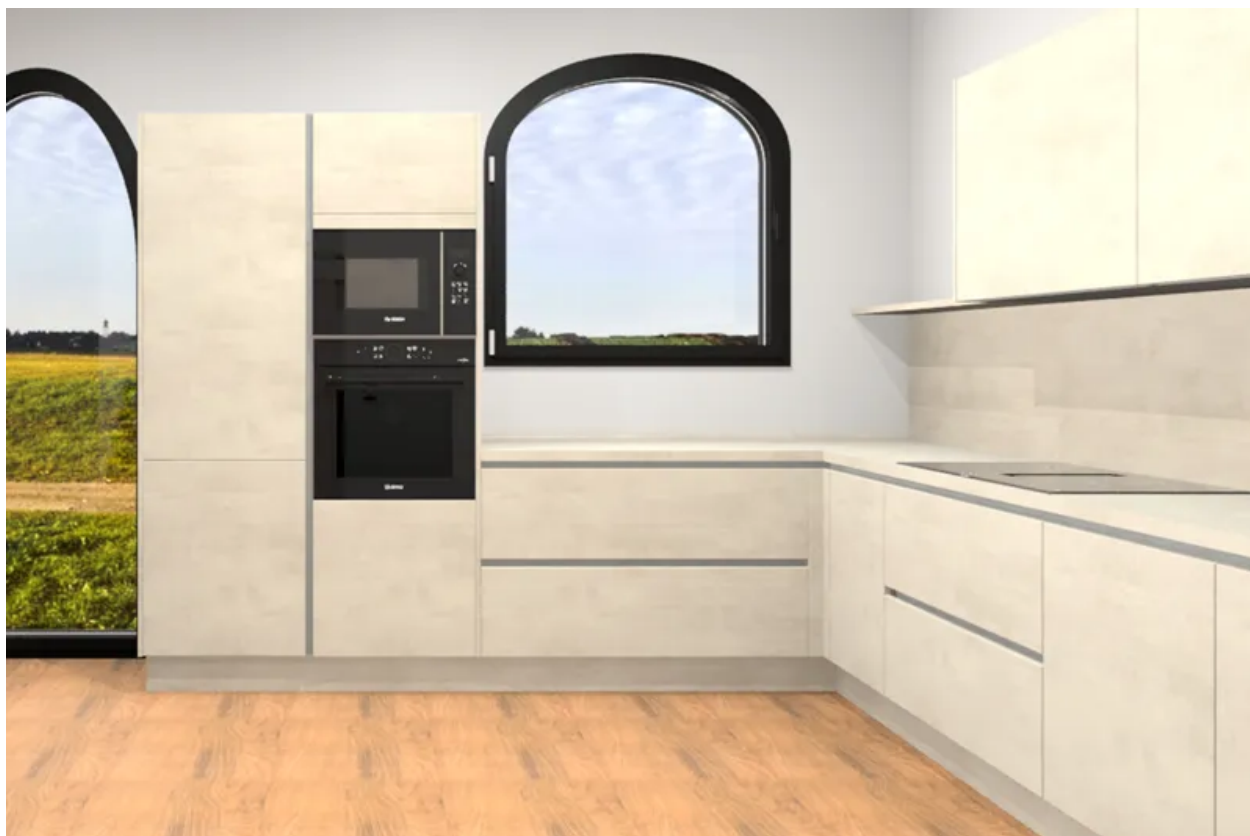
Küchenplanung WE 18 Perspektive frontal