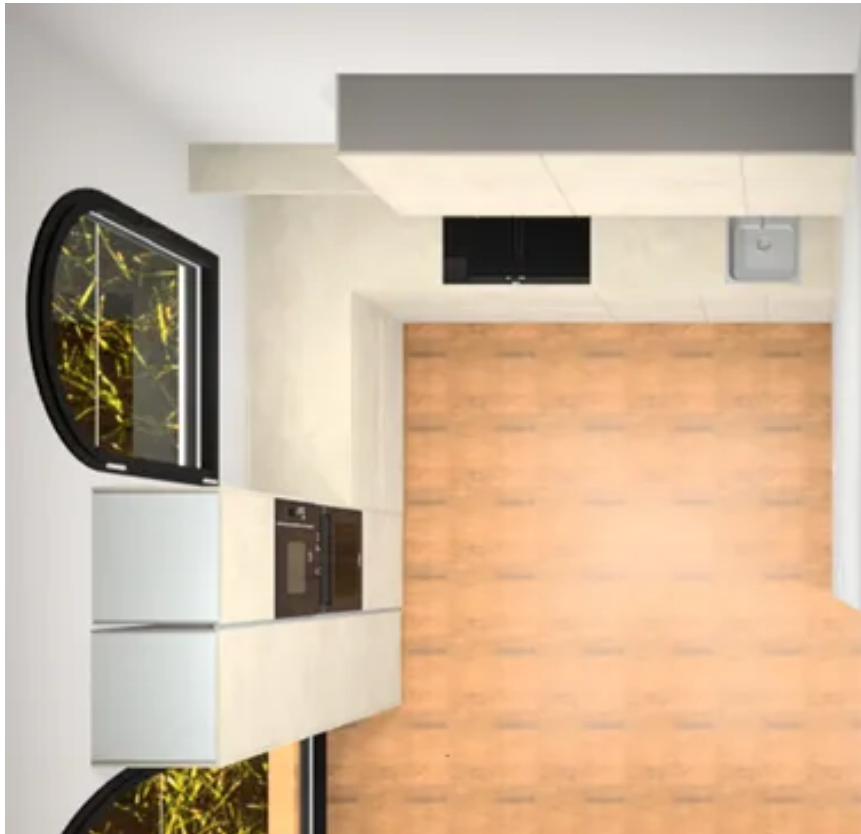
Küchenplanung WE 18 Perspektive von oben