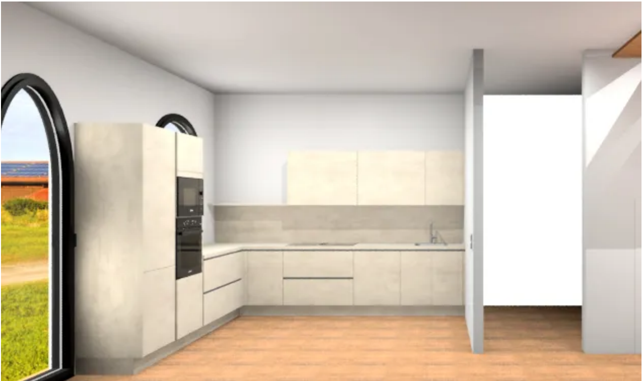
Küchenplanung WE 18 Perspektive frontal gesamt 1